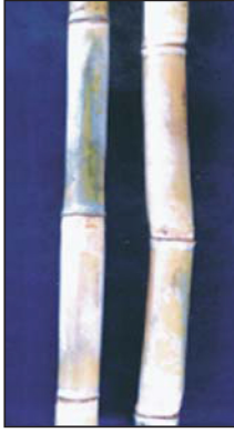
কাণ্ড ও পর্বমধ্য