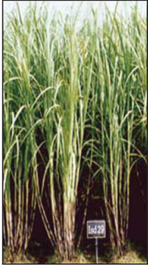
পূর্ণ বয়স্ক ইক্ষু গাছ