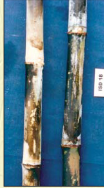
কাভ ও পর্বমধ্য