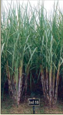
পূর্ণ বয়স্ক ইক্ষু গাছ