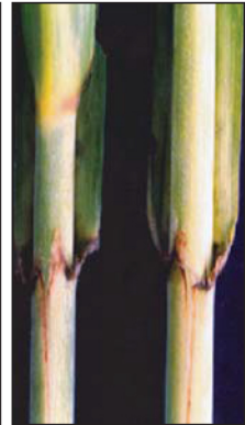
চোখ ও বাডগ্রোভ